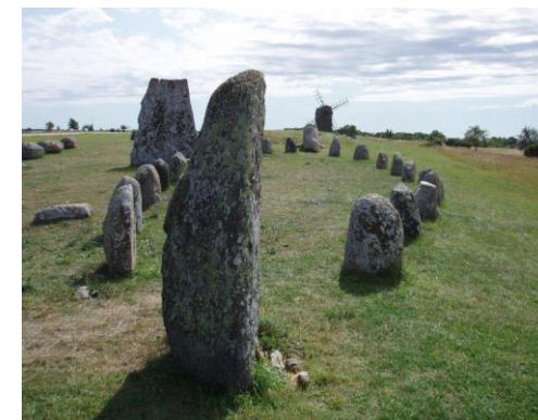
Gräberfeld auf Öland, Schweden

Die Anfänge des Allerheiligenfestes gehen bis ins 4. Jahrhundert zurück. Ephräm der Syrer und Johannes Chrysostomus kennen bereits ein Fest aller heiligen Märtyrer am 13. Mai bzw. am 1. Sonntag nach Pfingsten, der im griechischen Kalender heute noch der Sonntag der Heiligen heißt. Im Abendland gab es seit dem 7. Jahrhundert ein Fest aller heiligen Märtyrer am 13. Mai (Einweihung des römischen Pantheons zu Ehren der seligen Jungfrau Maria und aller heiligen Märtyrer am 13. Mai 609). Das Fest aller Heiligen (nicht nur der Märtyrer) am 1. November kam im 8. Jahrhundert aus Irland und England auf den europäischen Kontinent und hat sich bald allgemein durchgesetzt. ... Der Allerseelentag am 2. November geht auf den heiligen Abt Odilo von Cluny zurück; er hat diesen Gedenktag in allen von Cluny abhängigen Klöstern eingeführt. Das Dekret Odilos vom Jahr 998 ist noch erhalten. Bald wurde der Allerseelentag auch außerhalb der Klöster gefeiert. Für Rom ist er seit Anfang des 14. Jahrhunderts bezeugt.